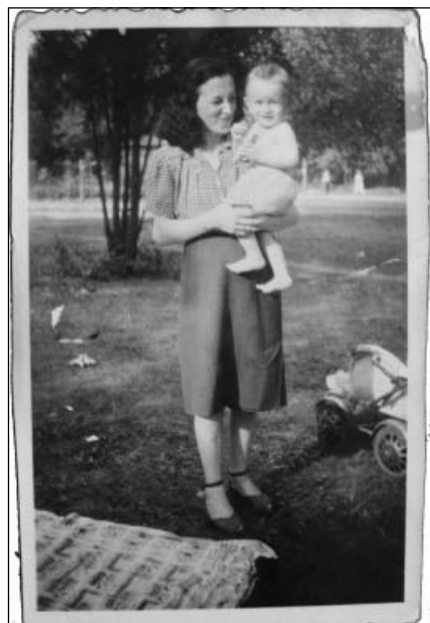
Sándor édesanyjával ugyanakkor